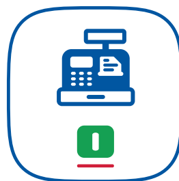
L'icona del launcher