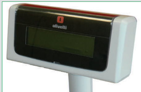
Display cliente grafico remotizzato