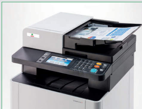
Alimentatore automatico Dual-scan