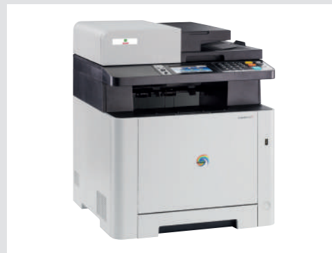
Design compatto ed elegante